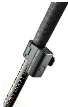
ソニーの「スマートゴルフセンサー™」

本レッスンシステムでは、ソニーの「スマートゴルフセンサー™」をゴルフクラブに装着し、ショットを打つことでゴルフスイングのデータを瞬時に解析いたします。クラブの軌道、フェース角、アタック角、ヘッドスピード、スイングテンポを測定でき、お客様とトレーナーはその場で確認・比較することができます。また、「スマートゴルフセンサー™」はRIZAP GOLF スタジオでのレッスン中だけではなく、自主練習時や、コースにおいても使用することが可能です。